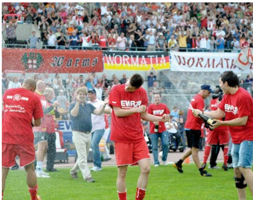
Der Aufstieg ist geschafft! Wormatia spielt nächste Saison Regionalliga

Ein Programm aus Kultur und Sport begleitet den Verein durchs Jubiläumsjahr, ein aufwändig gestaltetes Buch dokumentiert die wechselvolle Geschichte des Traditionsvereins mit großen und auch kleinen Zeiten. „Er ist immer noch eine Marke und ein Werbeträger der Stadt – dies wollen wir weiter entwickeln“, sagt von Massow. Der große Zuspruch, manchmal auch Euphorie, seien Anzeichen dafür, welchen Zusammenhalt der Sport schaffen könne.