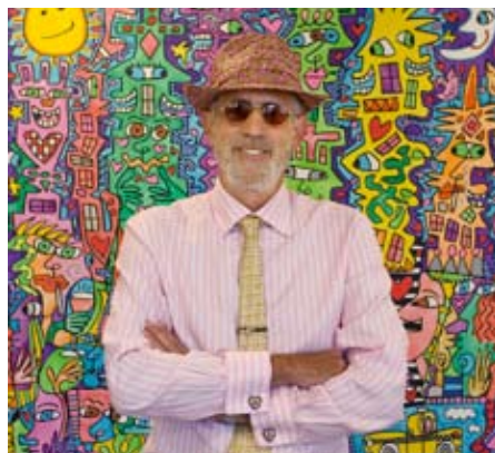
James Rizzi kommt zur Vernissage in Mainz

Vom 19. Juli bis 31. August 2008 veranstaltet das Congress Centrum Mainz erstmals in Deutschland die weltgrößte James Rizzi-Ausstellung in der Mainzer Rheingoldhalle. Über 1.000 Werke des bedeutendsten lebenden Popartkünstlers werden in den lichtdurchfluteten Ausstellungsflächen der Rheingoldhalle gezeigt. Die Besucher der Ausstellung können Ölgemälde, Acrylunikate auf Leinwand und Papier, Zeichnungen aber auch Skulpturen und limitierte sowie handsignierte Grafiken bewundern. Für die Vernissage am 18. Juli gibt es Tickets im Vorverkauf.