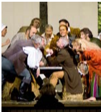
Besuchen Sie den Schinderhannes – bei der Carl Zuckmayer-Gesellschaft in Nackenheim

Der Schlemmerblock 2009 für Worms-Frankenthal ist da. Mit Sparkarte und Coupon für 18,68 Euro statt 24,90 Euro: www.schlemmerblock.de .