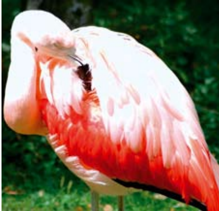
Freier Eintritt mit Sparkarte: Am Samstag, 23. August, ist EWR-Familientag!