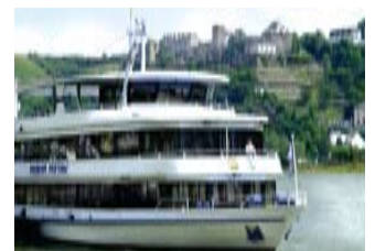
Mit der Bingen-Rüdesheimer auf dem Rhein zur Loreley