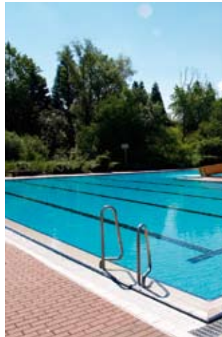
Hinein ins kühle Nass – zum Beispiel im Rheinhessen-Bad

Wir wünschen allen Wasserratten einen Super-Sonnen-Sommer mit einer Menge Temperaturrekorden!